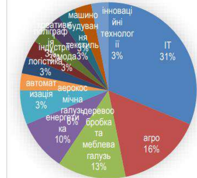
Рис. 11. Розподіл кластерів України за видами економічної діяльності

Україна незважаючи на досить високу активність створених кластерів як на місцевому, національному так і на міжнародному рівні (зокрема, участь в Європейській спільноті кластерів – European Cluster collaboration platform , кооперація з європейськими кластерами в обміні досвідом, кращими практиками та спільних транскордонних проектах) значно відстає в напрямку імплементації державної політики та стратегії.